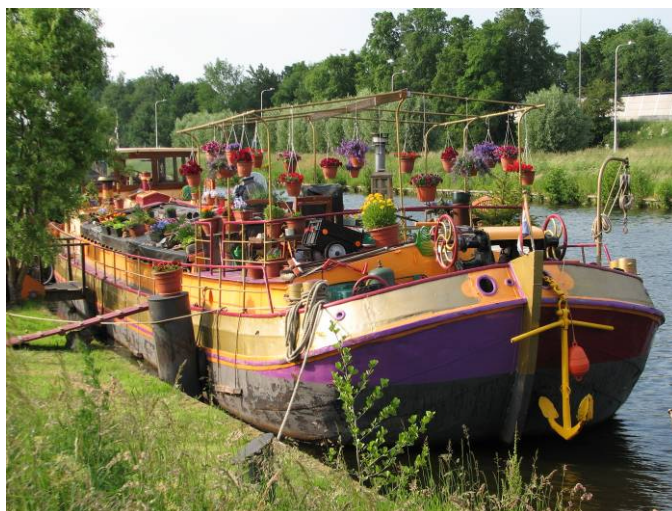
O čem také přemýšlíme...

Na situaci je možné reagovat nějakým systémovým krokem, jak se tendenčně říká „manažerským rozhodnutím“. Teoreticky i prakticky je situace neudržitelná především pro organizace tzv. středně velké. Mechanismus je podobný jako v privátní sféře. Přežijí ti velcí, ti malí se logicky přizpůsobí, jejich ztráty nebudou tak zásadní. Ti ostatní se buď ztratí nebo se stanou malými, vyhořelými a jejich původní tendence, tah a rozvoj se ocitne v nenávratnu. To se stane tehdy, pokud nedojde k zásadní změně.