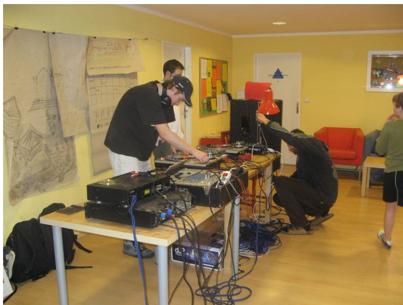
Koncert Inside Kru v klubu Suterén březen 2007