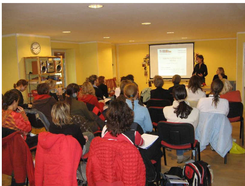
Otevřený mezioborový seminář o zkušenostech ze zahraničních stáží ze dne 13.11.2007