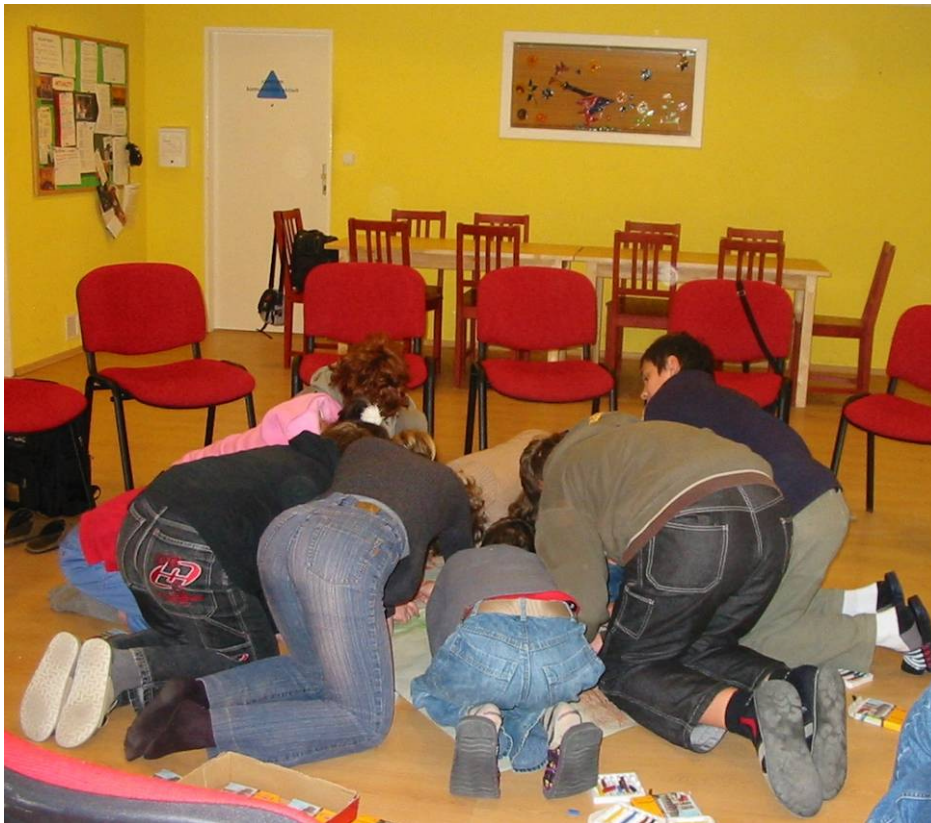
Program selektivní primární prevence