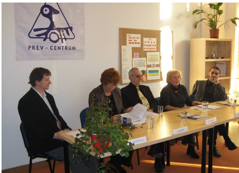
10. výročí založení o.s. Prev-Centrum, 28.11.2007